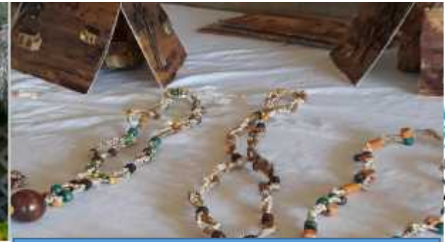
FINCA AGROTURISTICA LA PROTECTORA